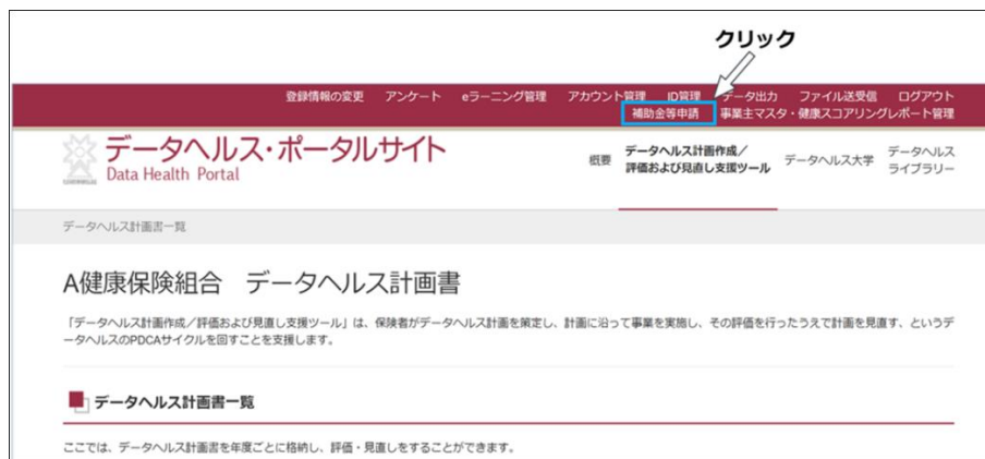
図 2 補助金等申請一覧のページへアクセスする