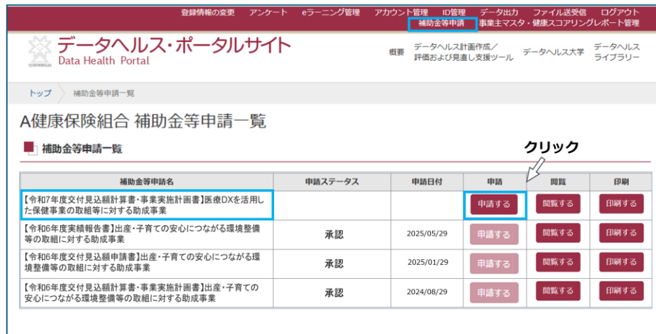
図 3 申請ページへアクセスする

1-3. 「医療 DX を活用した保健事業の取組等に対する助成事業【交付見込額計算書・事業実施計画書】」の「申請する」をクリックします。