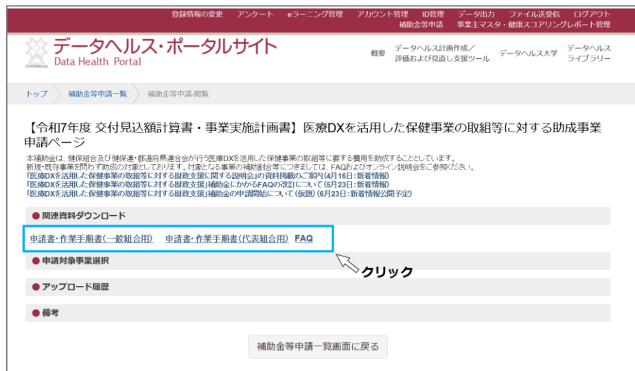
図 4 必要なファイルをダウンロードする

1-4. 申請ページでは申請書の様式や作業手順書等をダウンロードすることができます。