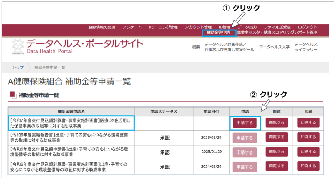
図 16 申請ページへアクセスする

3-1. 画面上部のメニューバーより「補助金等申請」を開き(①)、補助金等申請一覧「医療 DX を活用した保健事業の取組等に対する助成事業【交付見込額計算書・事業実施計画書】」の「申請する」をクリックします(②)。