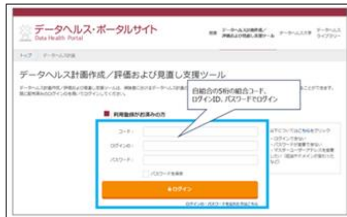
図 1 データヘルス・ポータルサイトログイン画面