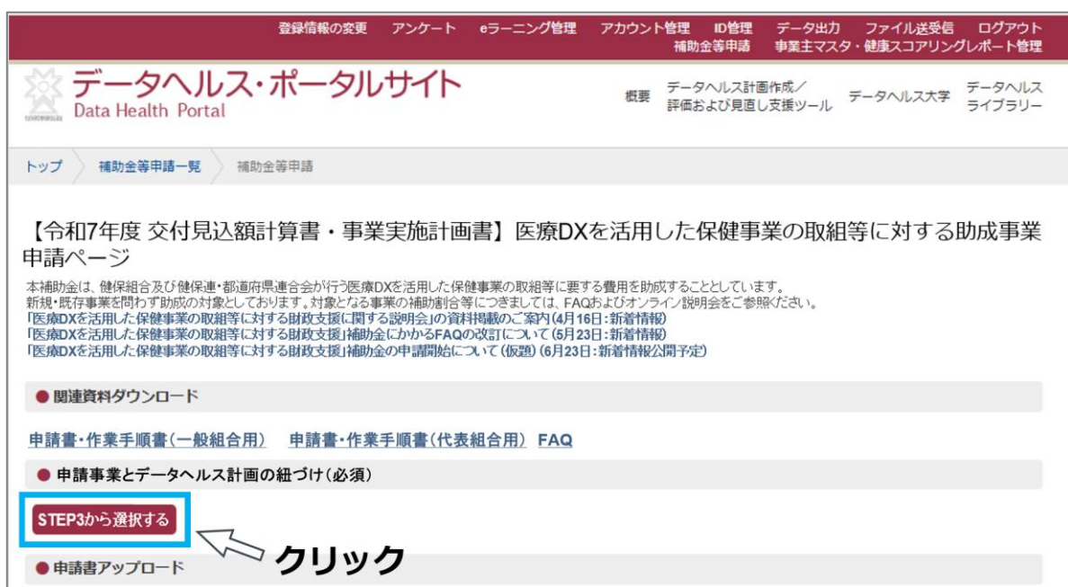
図 17 対象の事業を選択する

3-2. 令和 7 年度データヘルス計画(STEP3)から申請する事業に対応する事業計画を選択します。申請ページ中央にある「申請事業とデータヘルス計画の紐づけ」の「STEP3 から選択する」をクリックします。