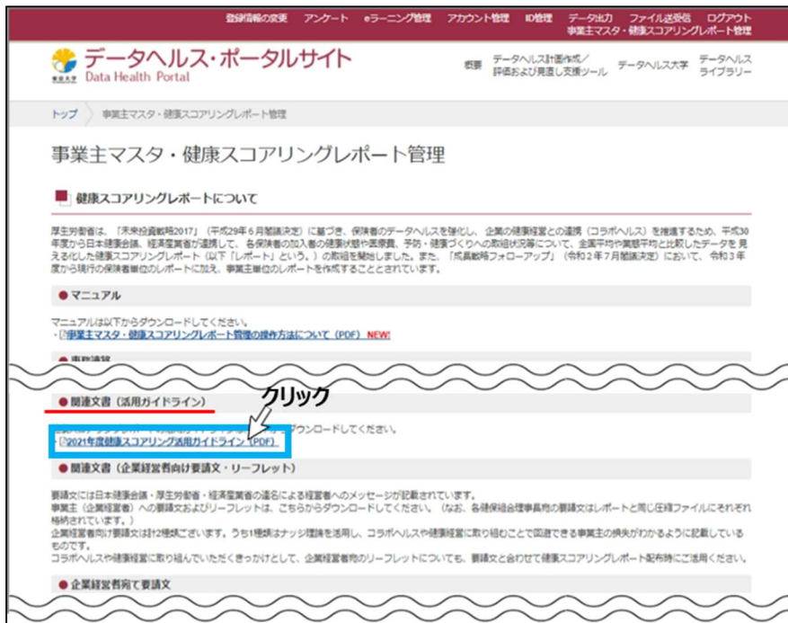
図 4 活用ガイドラインのダウンロード