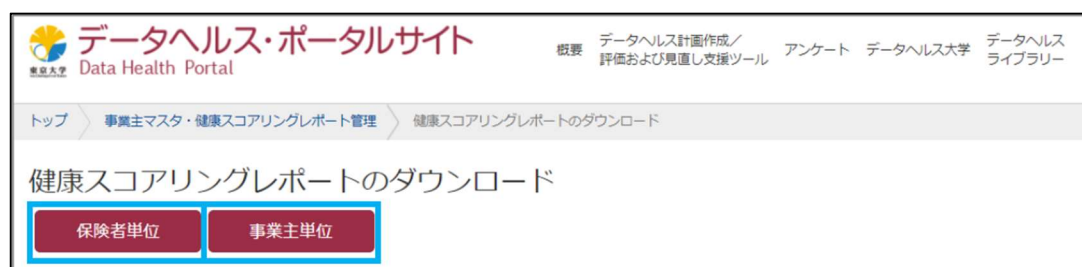
図 2 保険者単位・事業主単位のレポートをダウンロードする

「保険者単位」・「事業主単位」ボタンをクリックすると、それぞれの単位の健康スコアリングレポート・ダウンロードページに移動します。なお、令和 3 年 10 月に発行される「2021 年度版（2019 年度実績分）健康スコアリングレポート」は、保険者単位のレポートのみです。「事業主単位」のボタンは、令和 4 年 3 月発行予定の「2021 年度版（2020 年度実績分）健康スコアリングレポート」より利用できるようになります。