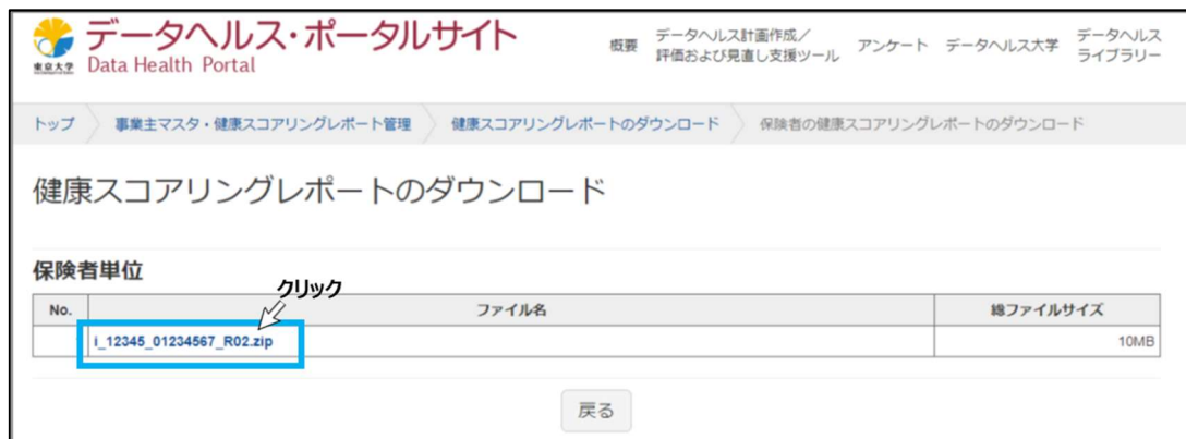
図 3 健康スコアリングレポート zip ファイルをダウンロードする

ファイル名をクリックすると、健康スコアリングレポート（zip ファイル）がダウンロードできます。ダウンロードしたファイルは、各組合内で、保管、閲覧、印刷してください。