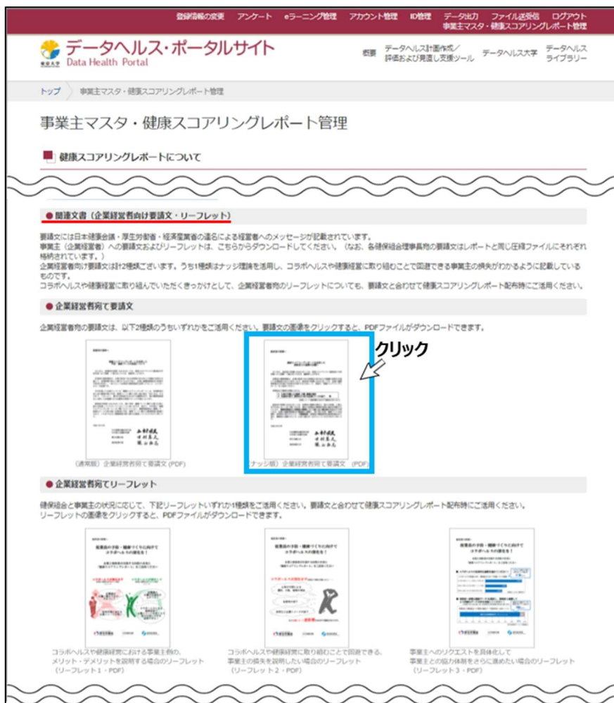
図 5 企業経営者向け要論文・リーフレット