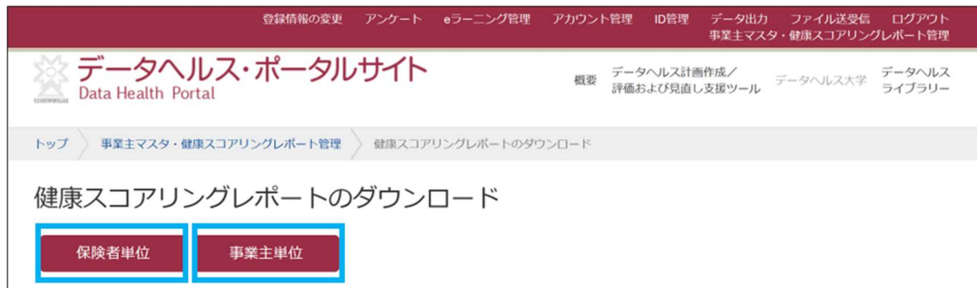
図 6 保険者単位・事業主単位のレポートをダウンロードする

「保険者単位」・「事業主単位」ボタンをクリックすると、それぞれの単位の健康スコアリングレポート・ダウンロードページに移動します（図 6）。