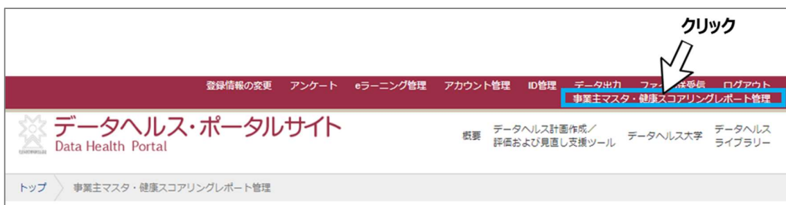
図 2 事業主マスタ・健康スコアリングレポート管理画面を開く

ログイン後、画面上部に表示される「事業主マスタ・健康スコアリングレポート管理」をクリックしてください（図 2）。事業主マスタ・健康スコアリングレポート管理画面のページが開きます。