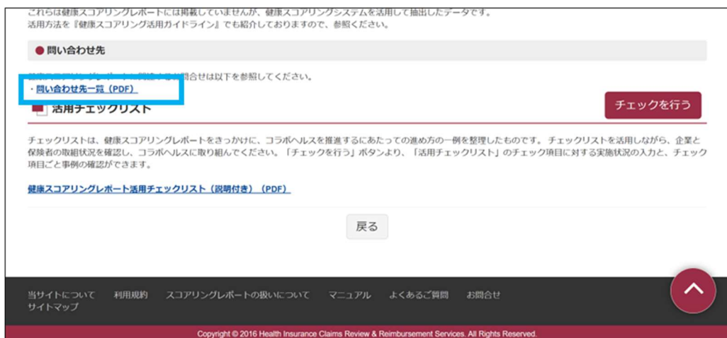
図 11 お問い合わせ先一覧のダウンロード