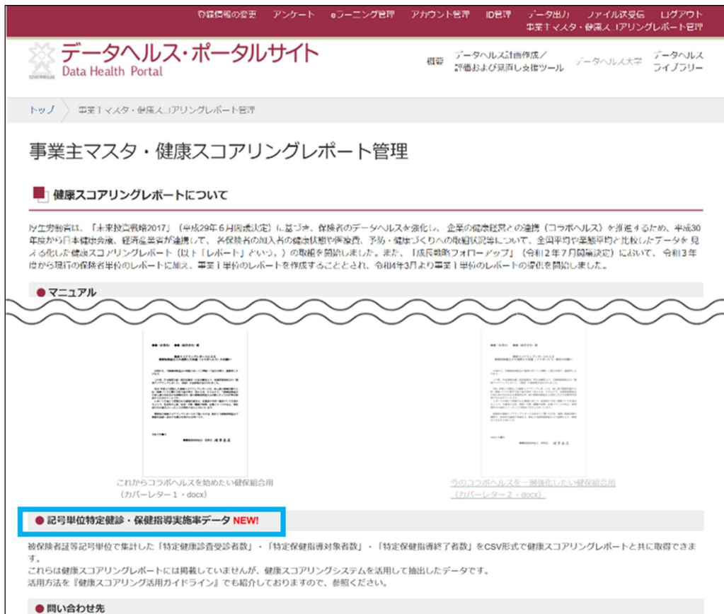
図 10 記号単位特定健診・保健指導実施率データの説明

活用方法を『健康スコアリング活用ガイドライン』でも紹介しておりますので、参照ください。