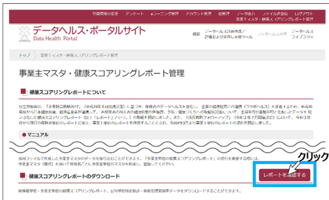
図 5 健康スコアリングレポートをダウンロードする

事業主マスタ・健康スコアリングレポート管理画面の、健康スコアリングレポートのダウンロード・「レポートを確認する」ボタンをクリックすると、健康スコアリングレポートのダウンロードページに移動します（図 5）。