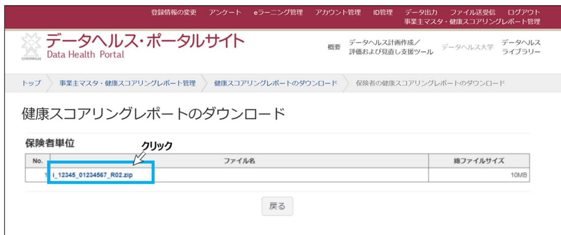
図 7 保険者単位の健康スコアリングレポート zip ファイルをダウンロードする

※複数年度のレポートが表示されている場合、実績年度を示すファイル名の末尾をご確認ください。例えば 2022 年度版（2021 年度実績分）のレポートはファイル名の末尾が「...R03.zip」です。