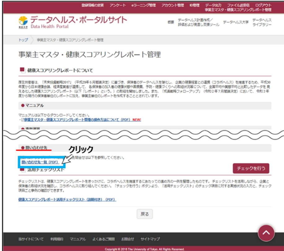
図 6 お問い合わせ先一覧のダウンロード