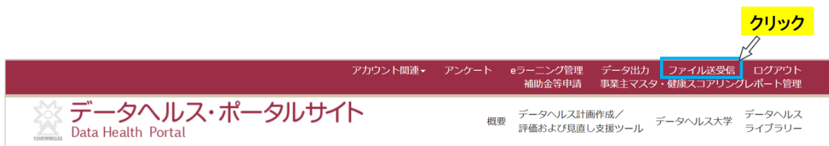
図2 ファイル送受信画面へアクセスする