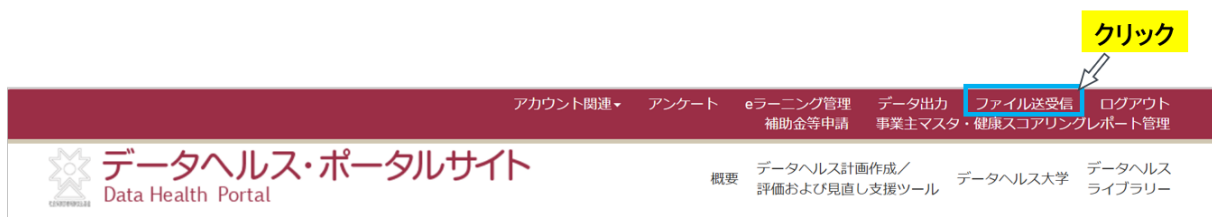
図 2 ファイル送受信画面へアクセスする

1-2. 「ファイル送受信」機能より実績報告書をダウンロードします。画面上部の「ファイル送受信」をクリックし、ファイル送受信(ファイルダウンロード)の画面のページを開きます。