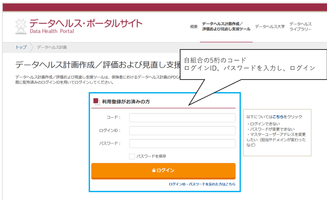
図 1 データヘルス・ポータルサイトログイン画面

1-2. 「ファイル送受信」機能より実績報告書をダウンロードします。画面上部の「ファイル送受信」をクリックし、ファイル送受信(ファイルダウンロード)の画面のページを開きます。