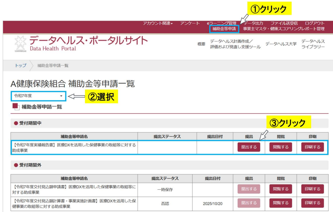
図 12 提出ページへアクセスする

画面上部のメニューバーより「補助金等申請」を開き(①)、補助金等申請一覧の年度選択から「令和7年度」を選択し(②)、提出期間中の補助金等申請名が「【令和7年度実績報告書】医療 DX を活用した保健事業の取組等に対する助成事業」の「提出する」をクリックします(③)。