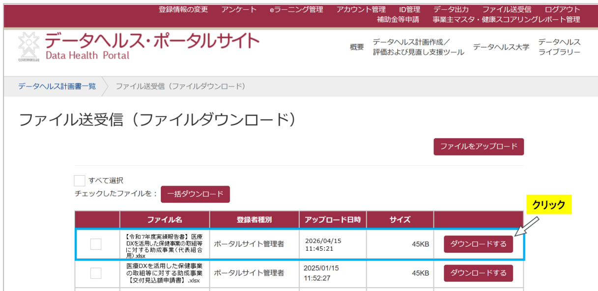
図 3 実績報告書をダウンロードする

1-3. ファイル送受信(ファイルダウンロード)より、ファイル名「【令和7年度実績報告書】医療 DX を活用した保健事業の取組等に対する助成事業(代表組合用).xlsx」の「ダウンロードする」をクリックします。