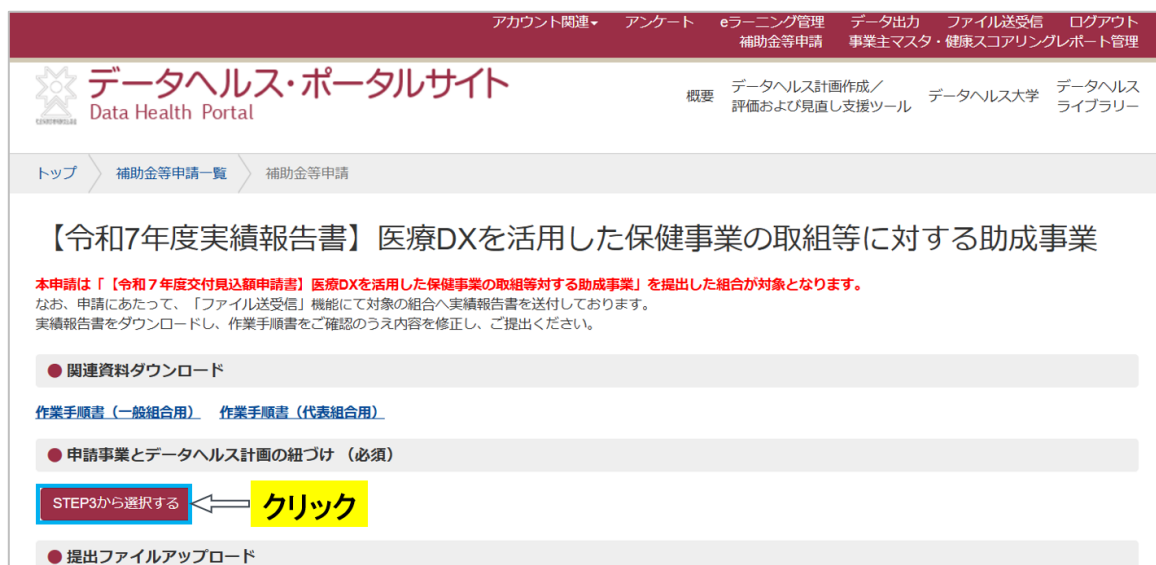
図 13 対象の事業を選択する

ページ中央にある「申請事業とデータヘルス計画の紐づけ」の「STEP3 から選択する」をクリックします。